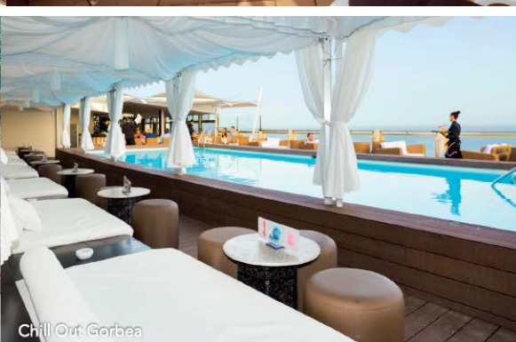
Chill Out Gorbea