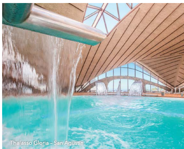
Thalasso Gloria – San Agustín